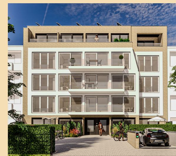
Neubauprojekt CLAS 69 - Claszeile 69, 14165 Berlin