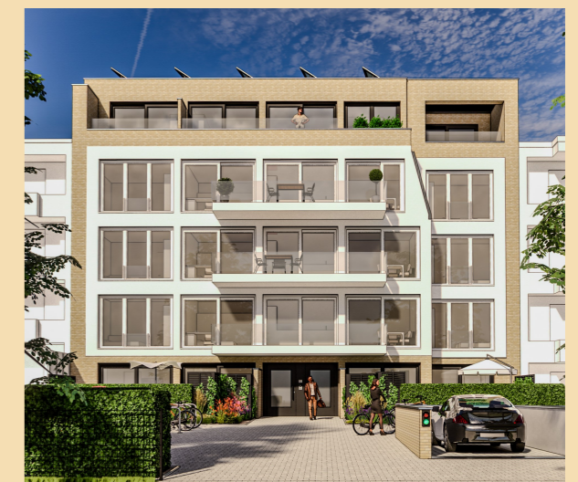
Neubauprojekt CLAS 69 - Claszelle 69, 14165 Berlin